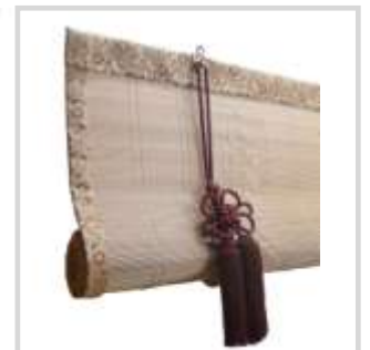
簾を巻き上げた様子